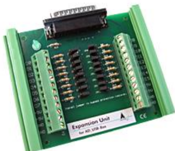
Expansion Unit für AD_USB-Box (im Lieferumfang enthalten)

Die AD_USB-Box verfügt über 8 massebezogene (single-ended) bzw. 4 differentielle analoge Eingänge sowie 4 digitale Eingänge. Weitere 16 digitale Eingänge werden über die zum Lieferumfang gehörende Expansion Unit bereitgestellt. Diese Eingänge sind zusätzlich kurzschluss- und überspannungsgeschützt.