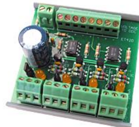
4-20 mA Strom-/Spannungswandler ET420 für 4 Kanäle (optional erhältlich)

Mit der AD_USB-Box können auch Ströme gemessen werden. Hierzu kann z. B. der optional erhältliche ET420 (4-20 mA Strom-/Spannungswandler) genutzt werden.